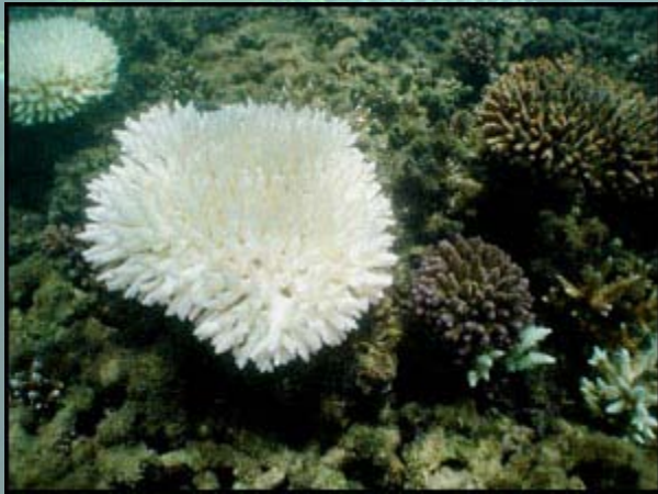
Figuur 9: Een gebleekte Acropora kolonie op het Great Barrier Reef, wat zijn zoöxanthellen heeft verloren. De kolonies rechts hiervan zijn onaangestast, omdat ze een ander type zoöxanthellum huisvesten. Deze verschillende typen, ook wel claden genoemd, bepalen welke koralen hogere temperaturen kunnen doorstaan.

Riffen wereldwijd zijn in grote moeilijkheden omdat onze aarde opwarmt. Hun symbiosealgen kunnen simpelweg niet de hogere temperaturen boven 30-32°C weerstaan, en de koralen stoten ze hierdoor uit. Elke zomer bleken meer en meer riffen, en complete stukken worden bleek. Korallen kunnen helaas niet lang overleven zonder hun partner, en zij moeten hun algenpopulaties herstellen voordat ze een hongerdood sterven.