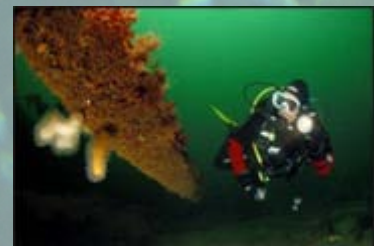
Figuur 8: Koralen komen overal ter wereld voor; hier worden ze gefotografeerd door duikers vlakbij de kust van Noorwegen. Deze zachte koralen groeien vaak op door mensenhanden gemaakte bouwwerken zoals scheepswrakken en roestige pijpen.

Er is nog niet zo veel bekend over deze mysterieuze gebieden, en expeditie vinden op dit moment plaats om uit te zoeken welke soorten hier precies leven. Het is wel bekend dat ook op deze riffen unieke diersoorten voorkomen.