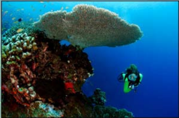
Figuur 1, rechtsboven: Een duiker zwemt richting een grote zgn. Acropora kolonie, een steenkoraal, op een rif rond de Raja Ampat eilanden te Indonesië.

Koraalriffen zijn reusachtige kalkafzettingen, die door de miljoenen jaren heen gevormd zijn door miljarden kleine ongewervelde dieren; koraalpoliepen genaamd. Al deze poliepen leven in kolonies, variërend van één enkele tot wel duizenden exemplaren. Zij produceren huisjes van calciumcarbonaat (aragoniet), vergelijkbaar met onze eigen botten. Bij gevaar kunnen zij zich terugtrekken in deze skelethuisjes, om te voorkomen dat zij worden verorberd door belagers zoals zeesterren of vissen. Op talloze tropische locaties in de wereld hebben deze bijzondere dieren gigantische onderwaterbergen gevormd, die wij nu koraalriffen noemen.