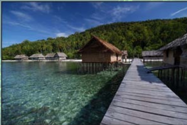
Figuur 7: De Raja Ampat eilanden in Indonesië behoren tot de meest soortenrijke gebieden op aarde. Deze eilanden omvatten franjeriffen, barrièreriffen en atollen.

Er bestaan diverse soorten riffen, ingedeeld op basis van hun vorm en de geologische processen die dit mogelijk hebben gemaakt. Franjeriffen zijn het meest voorkomend, en hebben zich parallel aan kustlijnen gevormd. De steenkoralen groeien hier tussen ongeveer 0 en 40 meter diepte. Vergelijkbare riffen zijn barrièreriffen, zoals het bekende Great Barrier Reef in Australië. Zij komen soms kilometers uit de kust voor. De derde vorm is misschien wel de meest bijzondere; het atol. Atollen zijn ringvormige riffen, met daarbinnen een ondiep watergedeelte; een lagune. Atollen starten eigenlijk als franjeriffen rondom een eiland; wanneer dit eiland zinkt door plaattectoniek, groeit het rif gewoon door. Uiteindelijk verdwijnt het eiland, en blijft alleen nog het rif over, met de lagune hierbinnen. Deze stukken natuur doen denken aan piratenbaaien en schatkisten, en zijn misschien wel de mooiste natuurgebieden op aarde.